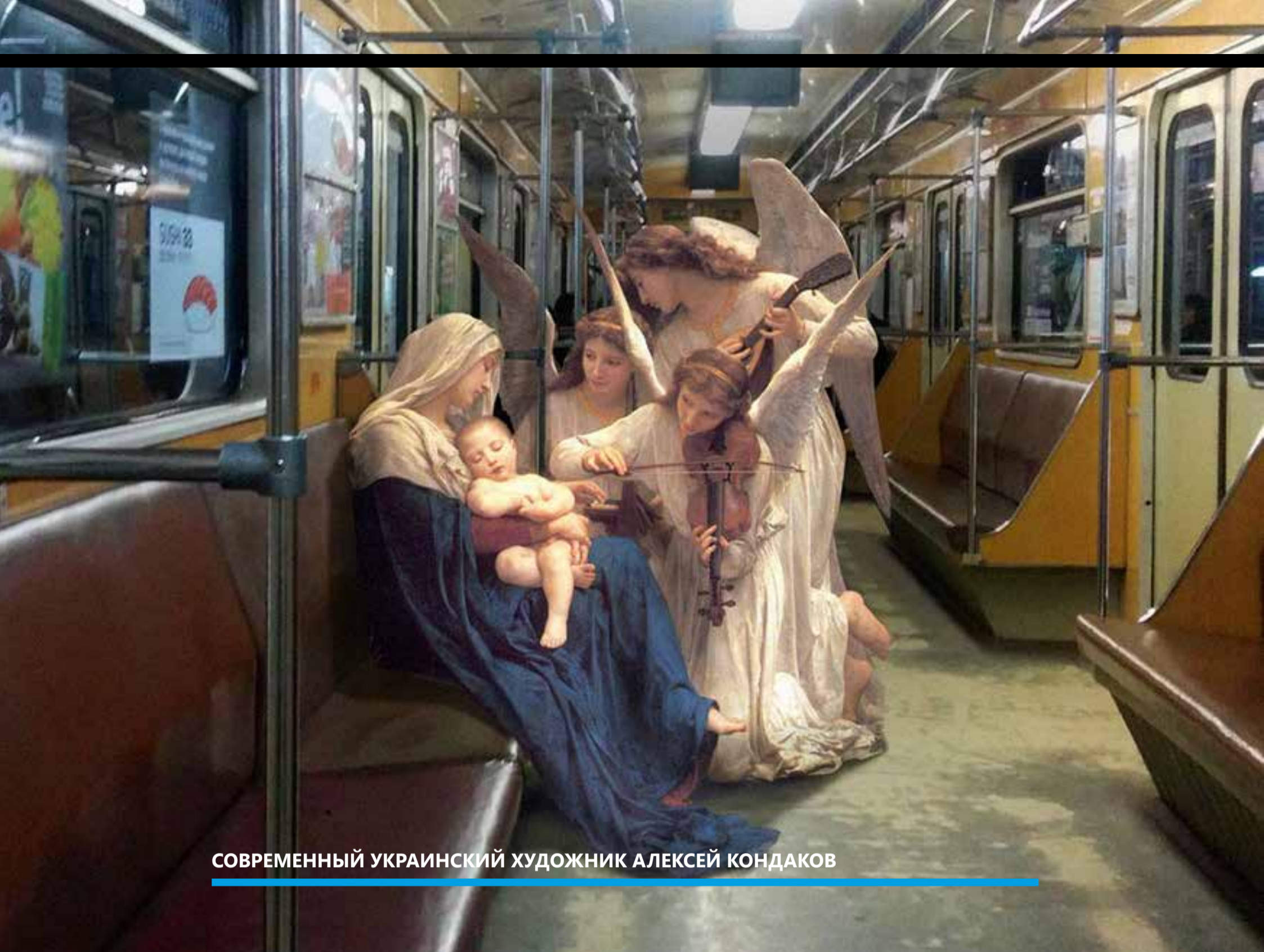
СОВРЕМЕННЫЙ УКРАИНСКИЙ ХУДОЖНИК АЛЕКСЕЙ КОНДАКОВ