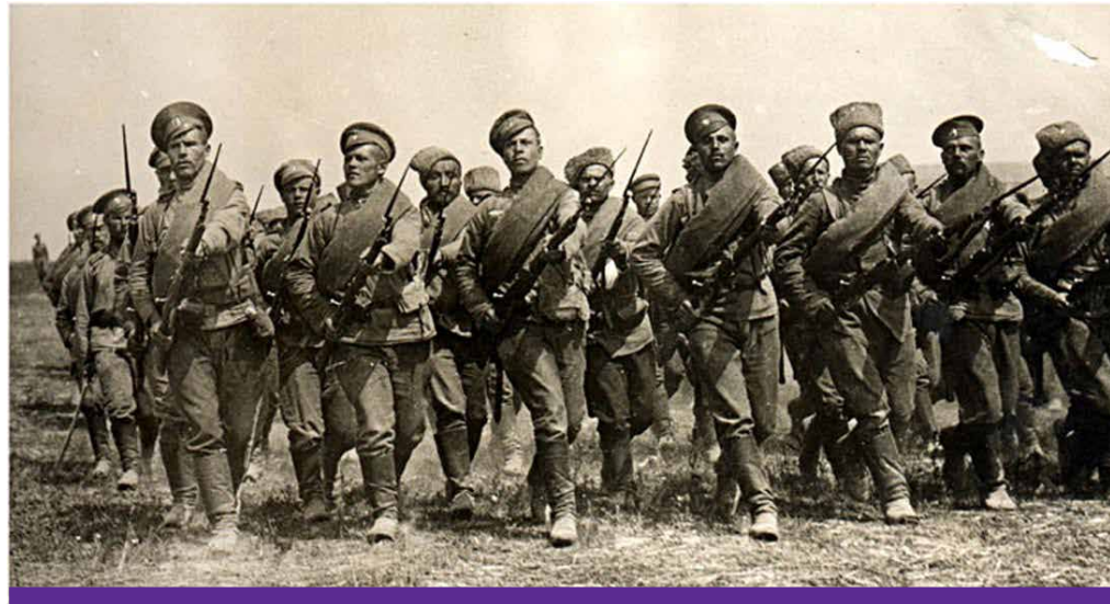
Миновали те времена, кожда немец уступал одному соседу землю, а другому – моря, себе оставляя небо. Мы требуем себе места под солнцем! Бернхард фон Бюлов, канцлер Германской империи в 1900–1909 годах